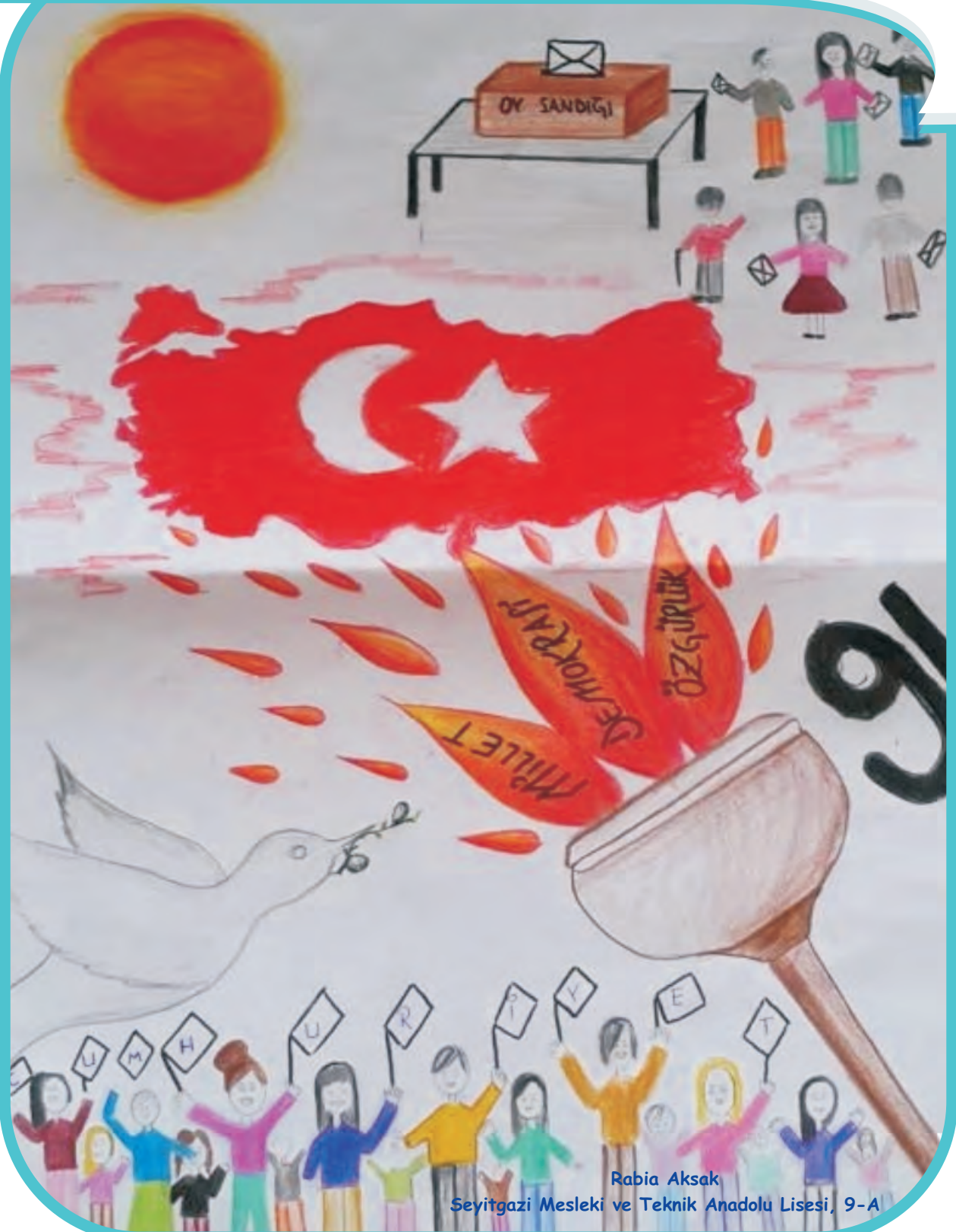
Rabia Aksak Seyitgazi Mesleki ve Teknik Anadolu Lisesi, 9-A

Eskişehir Osmangazi Üniversitesi'nin Ücretsiz Yayınıdır.