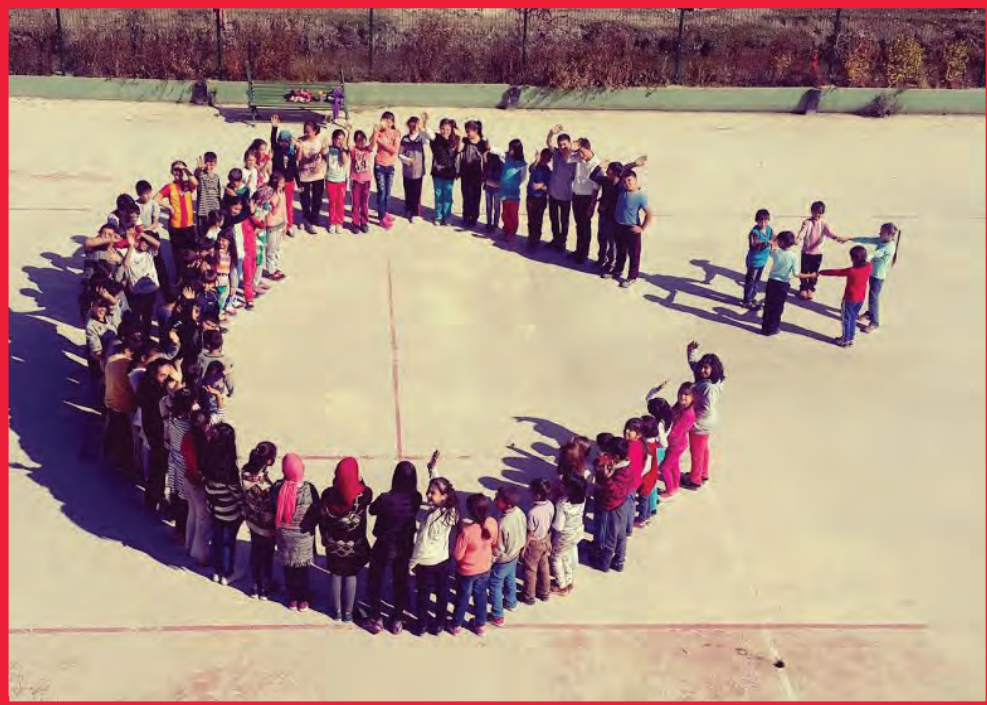
Seyitgazili öğrenciler Bayrağımızın Ay-Yıldız'ını yapıyorlar.

Öte yandan ilçeye bugünkü adını veren Seyyid Battal Gazi'nin 8. yüzyılda yaşadığı tahmin edilmektedir. Malatya serdarı Hüseyin Gazi'nin oğludur. Annesi Saide Hatun, Türk asıllıdır. Seyyid Battal Gazi, İslam Peygamberi Hz. Muhammed'in (sav.) torunudur. 740 yıllarında cereyan eden Afyon (Akroinon) savaşında aldığı yara sebebiyle şehit düştüğü bilinmektedir. 1207-1208 yıllarında Selçuklu hükümdarı Alâeddin Keykubat'ın annesi Ümmühan Hatun (Valide Sultan), Seyyid Battal Gazi'nin olduğu tepeye türbe, mescit ve medreseden oluşan bir külliye yaptırmıştır. Söz konusu külliye Osmanlı Hükümdarı 2. Bayezid zamanında tamir edilmiştir.