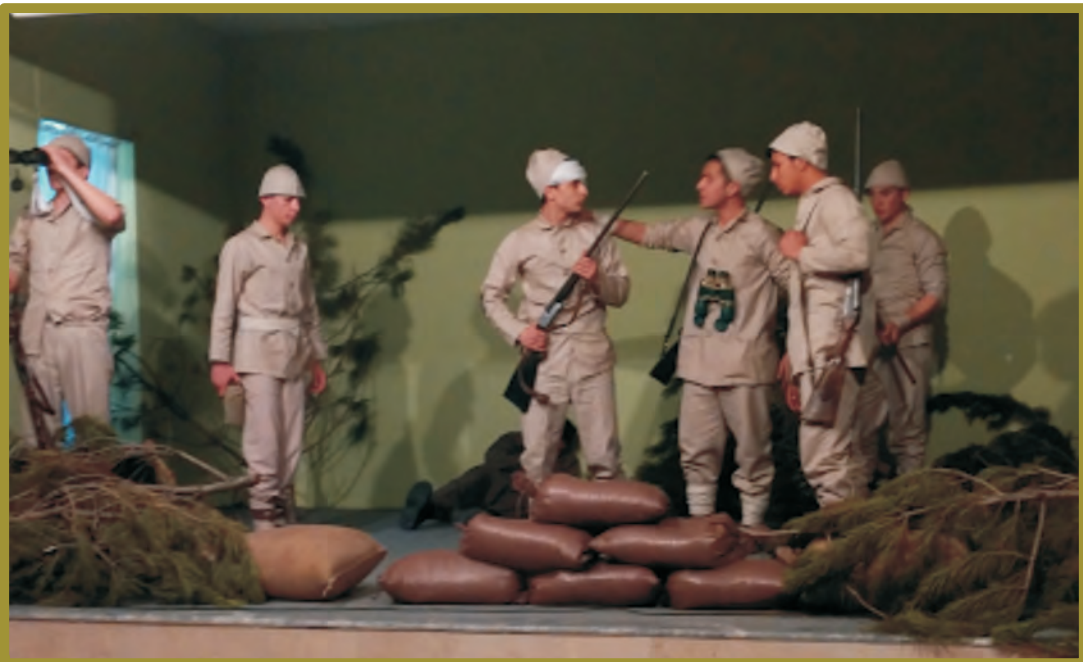
Seyitgazili öğrenciler bir tiyatro gösterisi canlandırırken.

Atalarımıza, dedelerimize söz veriyorum ki sizin canınızla ödediğiniz, kanlarınızı akıttığınız bu topraklar sonsuza kadar bağımsız olacak, ezanlar susmayacak, ay yıldızlı kan kırmızı bayrağımız nazlı nazlı dalgalanacak! Ne zaman şehit olunması gerekiyor ise sizler gibi bizler de o zaman hiç gözümüzü kırpmadan şehit olacağız.